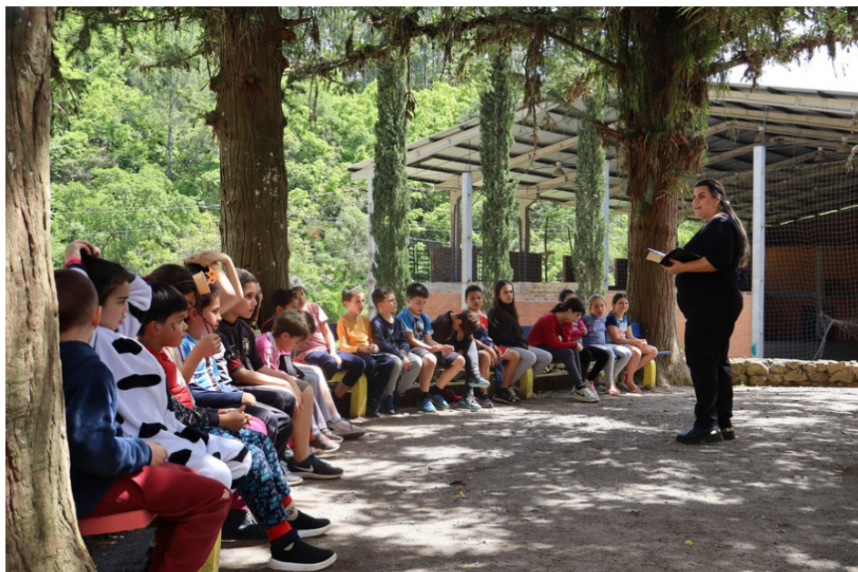
Andacht mit Kinder

Möge Gott euch alle mit seiner unendlichen Gnade segnen. Wir hoffen, dass wir auch in diesem wichtigen Jahr, in dem wir acht Jahrzehnte Mission und Dienst feiern, auf eure Unterstützung zählen können.