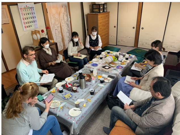
„Small Families“ - Missionsdienst in Kleingruppen

sie sich zu Jesus Christus. Danach arbeitete sie als Musiklehrerin und mit der Musikmission Euodia in Japan.