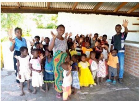
Unterricht für Kinder in der Gemeinde São Zaqueu de Tchola in Sena, wo sie jeden Samstag unterrichtet werden.

Seit jeher hat sich Gott um die Unterweisung der Kinder gekümmert (Sprüche 22,6). Sogar Jesus Christus sagte: „Lasst die Kinder zu mir kommen, denn Menschen wie diesen gehört das Himmelreich“ (Mt 19,13-14). Daher hat die Kirche von Mosambik ihr Bestes in diesem Dienst trotz des Mangels an Lehrmaterial gegeben, um die Evangelisierung und die permanente Unterweisung dieser kleinen Kinder Christi zu erleichtern.