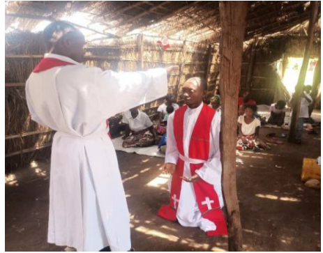
Bei der Amtseinführung neuer Pastoren

heute hat Gott die Verkündigung des Evangeliums auf der ganzen Welt gesegnet. Selbst inmitten vieler Herausforderungen ist Gott treu geblieben und hat sein Volk unterstützt. Auch in Mosambik sind die Herausforderungen groß und zahlreich, wie wir bisher gesehen haben. Gott hat durch sein Wort Großes vollbracht. Wenn wir jedoch etwas genauer hinschauen, erkennen wir, dass die Not groß ist. Deshalb ist es wichtig, wann immer möglich, Sonderopfer für die Missionsarbeit in Mosambik zu erwägen, die in theologische Ausbildung und spezielle Projekte vor Ort fließen.“